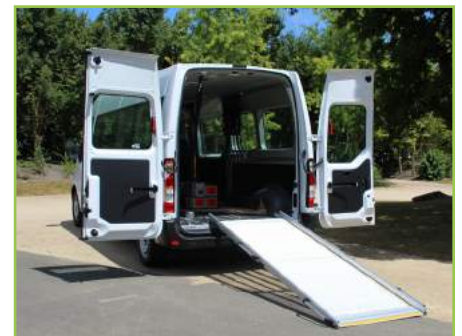
Accès version Sthandy : accès arrière rampe légère antidérapante, relevable manuellement en 2 parties