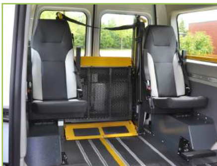
Siège multi-fonctions : dossier inclinable, facilement démontable, pivotant