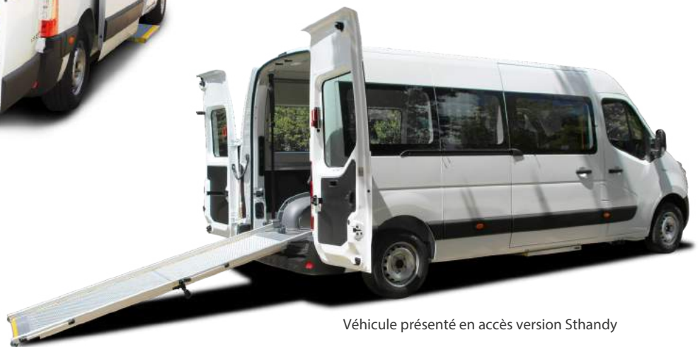
Véhicule présenté en accès version Sthandy