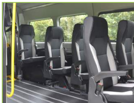
Large espace intérieur modulable. Matériaux lavables en harmonie bi-ton.