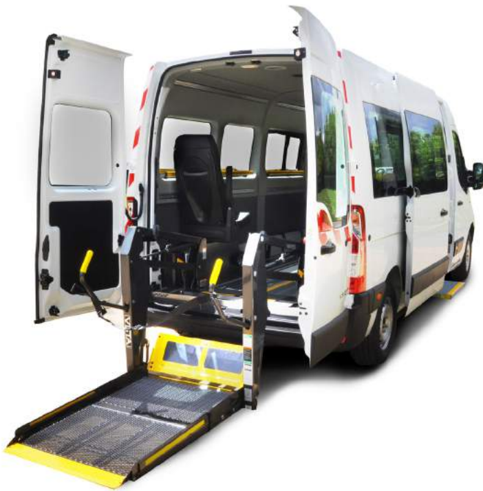
Véhicule présenté en accès version Haccess Plus